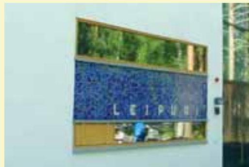
Детский сад "Лейпури", г. Хельсинки, Финляндия