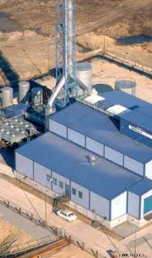
И. О. О. Wartsilä

е И И А И И % О И И Н " И А И У О О У И И " Е Н И О " И О О У, . 32 И А, И, И У У И И, И А А И О И, Е И Е О, И И " И % Е, И У А И А Е "СН УОЕИ Н"