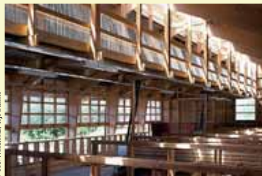
1 000 Woodfocus, Yrjö Saunio