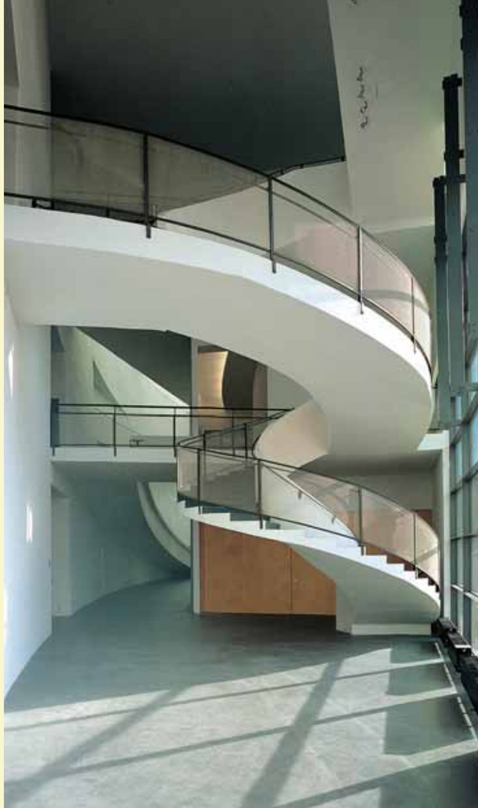
Музей современного искусства "Киазма", г. Хельсинки, Финляндия