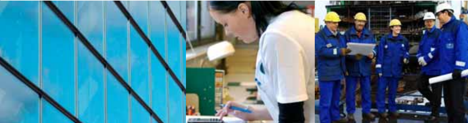
Í Ò Ò: Teknologiateollisuus ry

ì Á Í ò ° ò Ò Û † ò Û † ò Í È Ì Á ò Ò Í †- Á, †, Û: ò- ~ Û Ó Í ò, È % Á Û Á Î, ò Ú, Û Á Û Ì Á Ò Í Ó Í Ì Ó Á Û, Á Î È- Á Î È Á % ò Í È ~ Í Á Í Ú Ò Í È Í È ~ Í Á Í Ú Ó Ú Á Ì È- Á Ò Í È ì ò È ò Ú Á Ì, , ò ò Ò Û †, Á ò Ó % Ò Í ~ È È † Á Î È- Ì ° Ì ò Ú Á ò ò È Á, Ó % ò Ú, †,