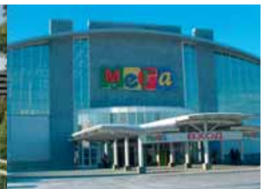
Гипермаркет "Мега", Москва, РФ