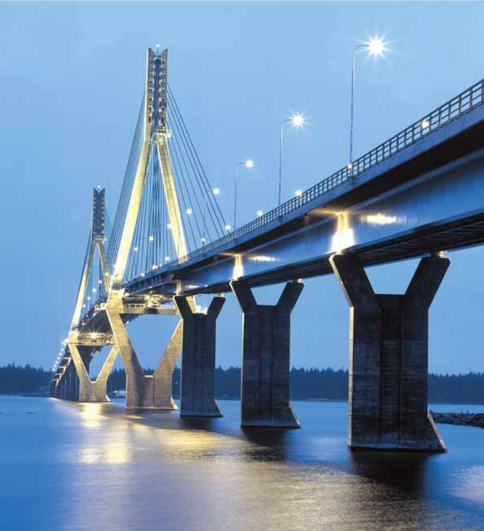
Мост в пос. Райппалуото, Финляндия