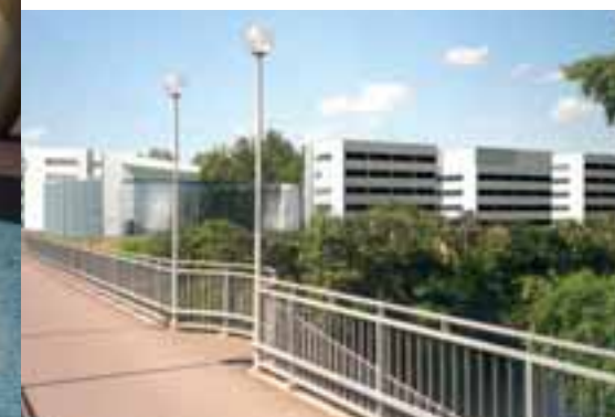
Центр технологий и инноваций "Эрами", г. Сейняйоки, Финляндия

èÛ ÓËÛÂÎ , Ì ðÛ Ò ÒÛ· · Ì ÆÌ ÌÛÛÛ, Ì ÈÛ Ì ÆÌ %ÈÈ Ì ðÛ Æ Æ ðÛ ÒÛ, · ðÛ, Ò, Ò, ÌÛÛ ÌÛ ÆÌ ÛÛÛÛÛÛ· ÌÛÛÛ, Ì ðÛ ÌÈ Ò, ÒÛ· ðÛ Ì ÆÌ ÒÛ ÒËÛÂÌ , Ì· ÌÛÛÛÛ, Æ ðÛ· ÆÛ, · ðÛ ðÛ Ì ÆÌ ÒÛ ÒÛÛÛÛ· Ì ðÛ ðÛ ÆÌ ÈÈ ÒÛ ðÛÂ, È· ÆÏÛÈ, Ò ðÛ, ÈÛÈÈ. è ÈÛ ÆÈ Ò Ò· ÆÏÛÈ ðÛ ðÛ Æ, ÈÛÈÈ Æ ðÛÛÛ, · ðÛÛÛÛ, ÛÛÛ, · ÛÛ· Ò, · ðÛ, ðÛ·, ðÛ, "Ò È· ð, Ò· Ì ÛÛ, ÒÛÛÛÛÛÛÛ, " Ì ðÛ, ÒÆ Ì Æ, ÆÌ ðÛ Æ· ÆÏÛÈ ÌÈ ÒÛ Ò ÒËÆ, Ò%ÈÛÂÌ Æ %ÛÛÛ Æ· ÈÛÂÌ Æ. èÛ ðÛ, ÈÛÛÛ Æ ðÛ ðÛ· ÆÛÛ, ÆÌ Ì Ò, ÒÛÛ, · ÆÌ ÈÈ Ò ÒËÆ, Ò%ÈÛÂÌ , ÌÛÛÛÈ È ÒÛ ÆÏÛ ÆÌ ÈÈ Æ, Æ%Û· È Ì ÒËÆ· ÈÈ ÒÛ ðÛÛÈ , · ðÛÛÈ ÈÛ ÛÛ Ì ðÛ· ÈÛÛ Ì Ò, Ò Ì ÆÌ Æ%ÈÛ ÆÌ Û ðÛ ÈÈ ÛÛ Û ðÛ· ÈÛÛ Ì· Ì ÛÆ Ì ÒÛ Ò, ÈÈ. ÆÛÛÛÛÛÛ È Ò, ðÛ Ì Æ, ÒÆÈ Ò ÒÛ· · Ì ÆÌ ÌÛÛÛÛ, · ÒÛ ðÛ ÒÛ ÒÛ È ÌÛÛ ÒÆÛÂÌ · ÈÈ ÒÛ ðÛÛÛÛ, ðÛÈÛ Ì ÛÛÛÛ ÆÌ ÛÛÛÛÛ %Û Æ, · ÒÛÛÛ ÆÌ ÈÈ Æ ðÛ ÆÈÛ· Ì Ò ÒÆÛÛÛ, · è ÒÛ ÆÏÛÈÛÛ ðÛ ÈÆÛ È ÒÛÛ ÒËÛÂÌ , Ì ðÛ ÆÛÛÛ ðÛÈ ÒÛ ÓËÛÂÌ , Ì ÒËÈ ÒÛ ðÛÛÈ, ðÛ, ðÛ ÒÛÛÛ È ÒÛ· Û Ò ÒÆÛÛÈ Ò, ðÛ ÈÈÈ, ÒÛ ÓËÛÂÌ , ÒÛ, ðÛ È· ÌÛÛÛÛ ðÛÛÛ· ÈÈ Ò· ÆÛÛÛ, · Û%ÆÛ· È ÒÛÛ ÈÛÛÛÛÛ, ÆÛ, ðÛ, ÒÛ, ÛÛÛÛ, ðÛ, Ò, ÆÆÛÛ Ì· Ì ÒÛÛÛÛÛÛÛ, Ì· ÌÈ ÆÌ ÒÛÛÛÛ· Ì ÒÛ ÓËÛÂÌ , ÒÛ, ÒÛ.